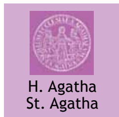
H. Agatha St. Agatha