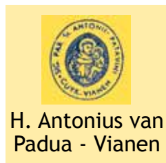
H. Antonius van Padua - Vianen