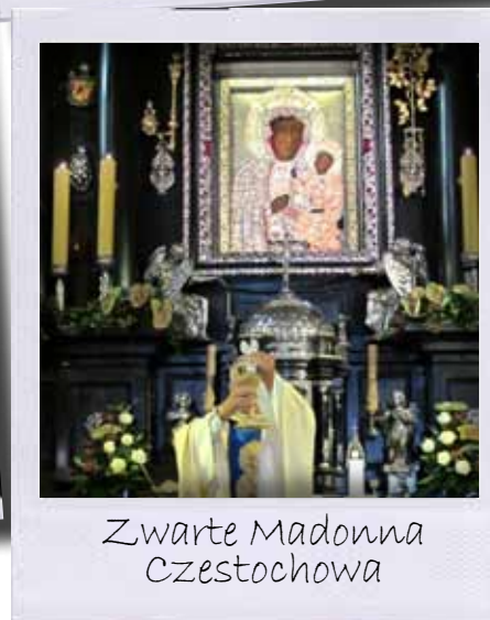
Zwarte Madonna Czestochowa