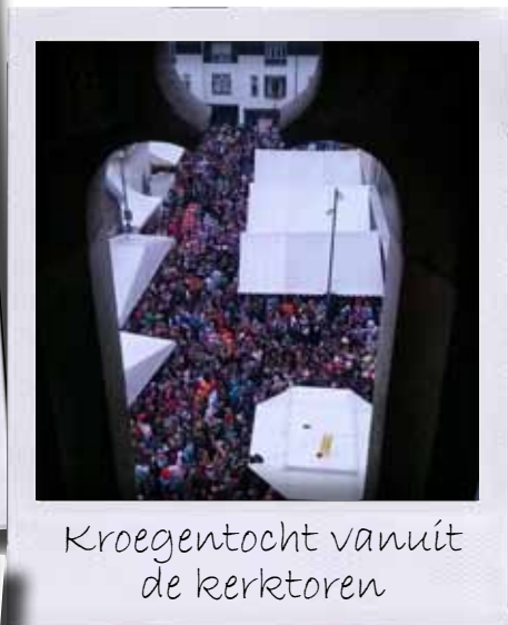
Kroegentocht vanuit de kerktoeren